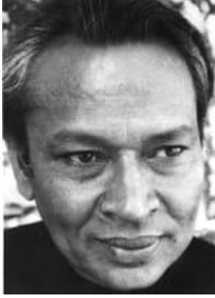
कवि रघुवीर सहाय